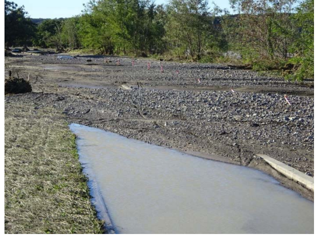
公園外周の歩道、自転車道、自動車道は埋まった