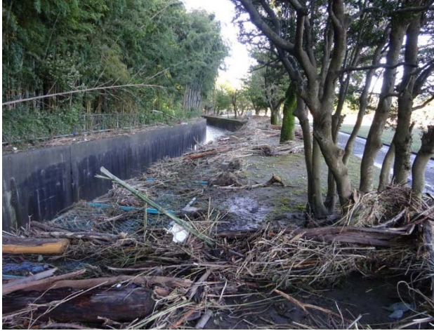
下の川に転落しそう