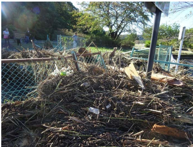
昭島市境の橋も壊され、ゴミが満載