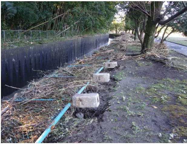
下の川のリフェンスは根こそぎ倒れている