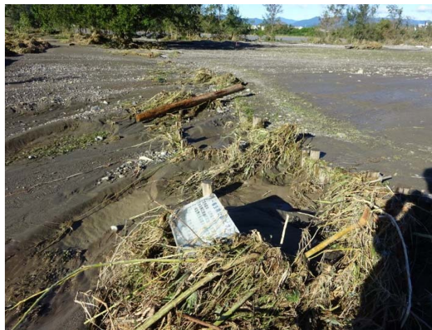
ビオトープも埋まってしまった