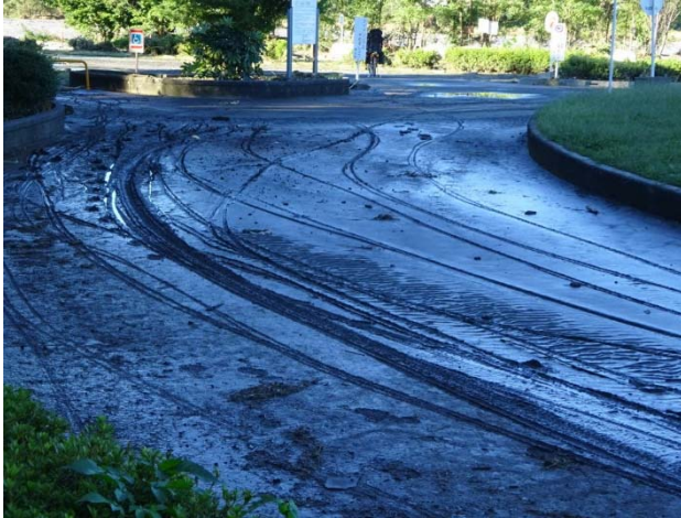
駐車場への入口には泥が