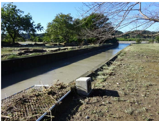
下の川河口、昭島側のフェンスも