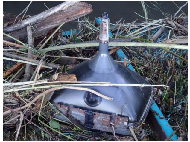
中にはこんな物が、ブラウン管でしょう