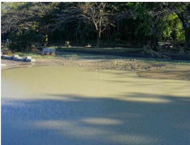
ジャブジャブ池も少し土砂で埋まって