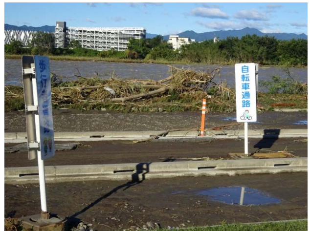
お、看板が倒れていないぞ