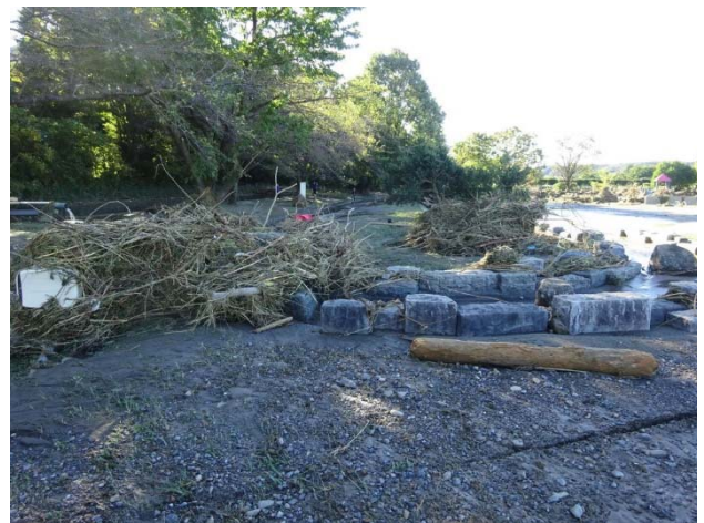
水の取り入れ口もゴミが