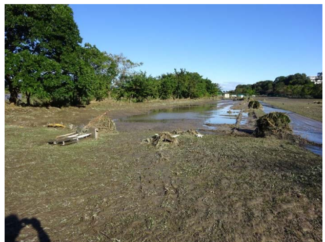
こちらの駐車場にも土砂が