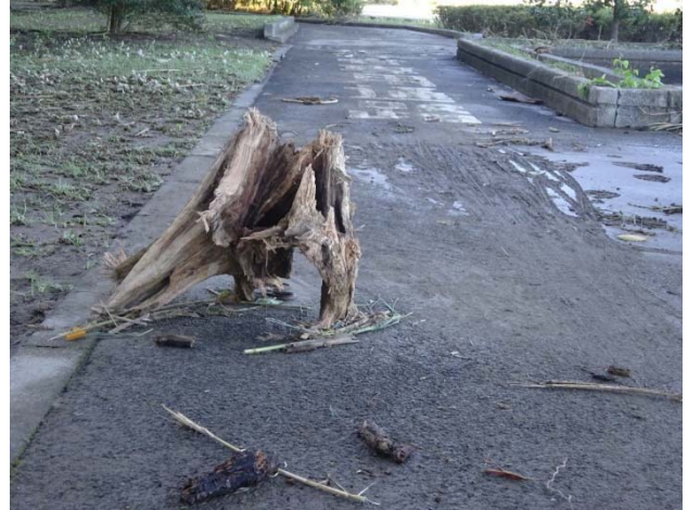
遊歩道に流木のオブジェが