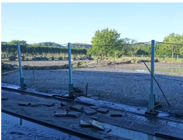
テニスコート、ネット張ったまま？