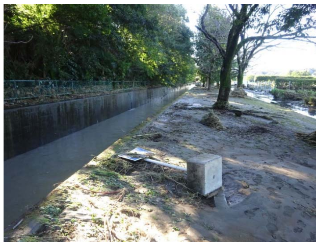
ここは柵が跡形もなく