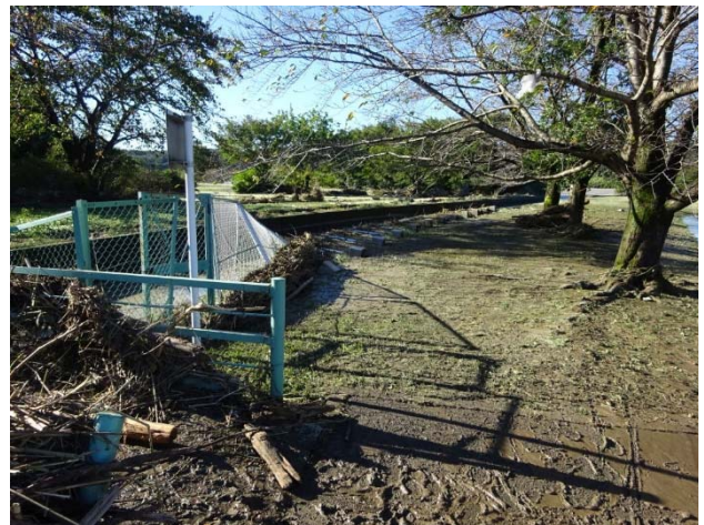
この先もフェンスが