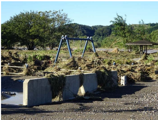
児童遊園もゴミだらけ