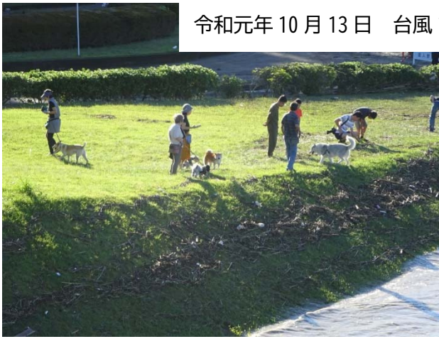
公園の入口は犬の散歩&様子見の人が