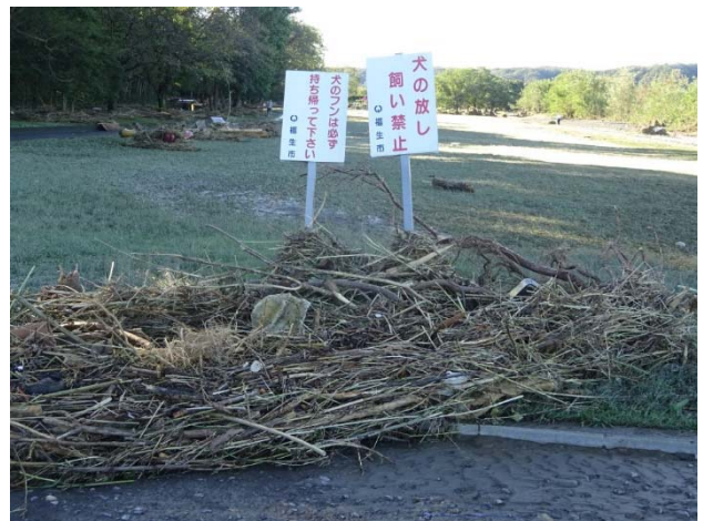
ここも看板は無事、でもゴミが