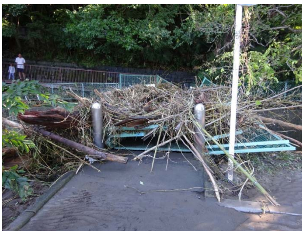
どうどう橋は壊され、ゴミが