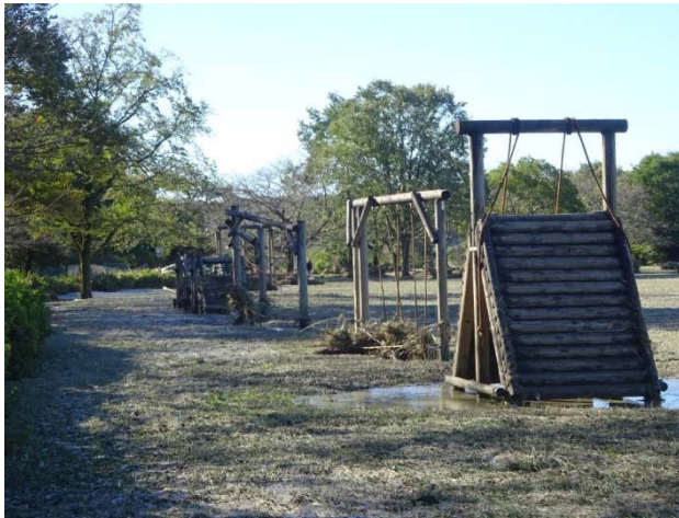
遊具もこんな具合、ぬかるんで近づけない