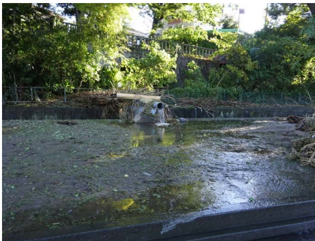
熊川分水からの配管が壊れ、水が垂れ流し