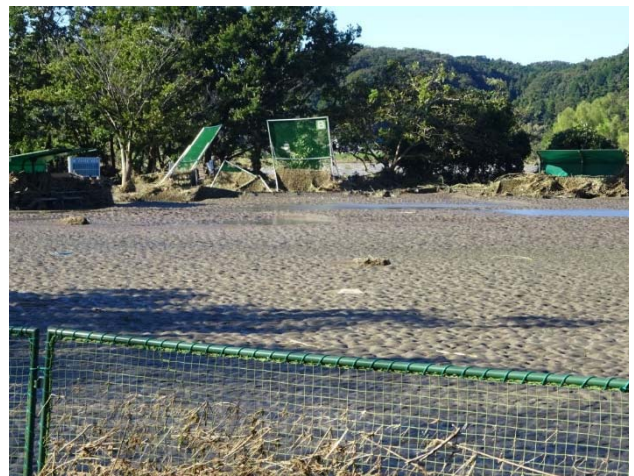
こちらのコートも土砂がいっぱい