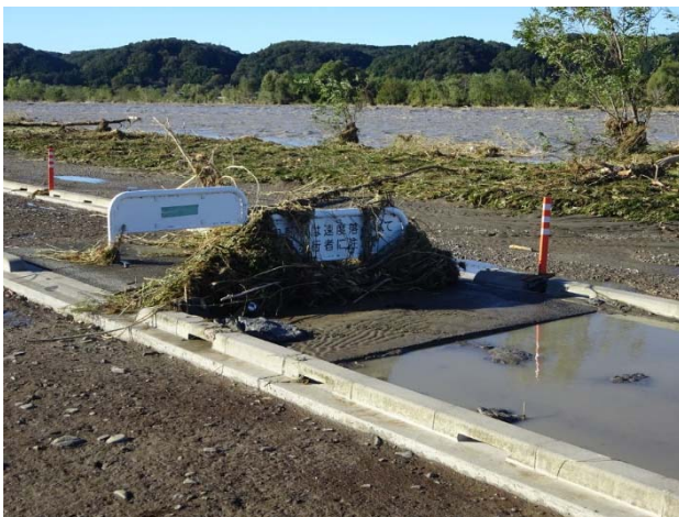
スピード抑止の看板にはゴミが