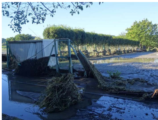
テニスコートの倉庫は破壊され