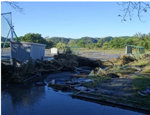
野球場も無残な姿に