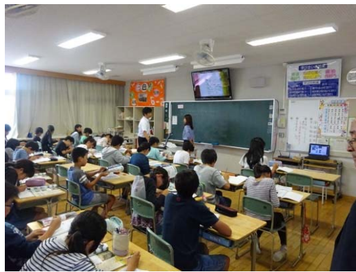
ICT機器を使った授業風景

第六小学校がコミュニティ・スクールに指定されたことから、推進にあたっての調査を行いました。小牧市はICT教育に古くから取り組んでおり、特に校務のICT化について「校務情報化の現状と今後の在り方に関する研究」も行われています。当市における校務のICT化についてはこれからの課題です。そこで、校務のICT化、児童に対するICT教育を調査しました。全ての教職員が児童生徒の良い行動を記録する「いいとこ見つけ」は衝撃的でした。情報が共有され、学期末にまとめて通知表に反映されます。市立小牧小学校にもお邪魔して、コンピュータ室や実授業で行われているICT活用状況も視察しました。