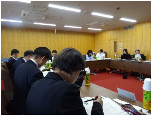
委員会室での研修風景

第六小学校がコミュニティ・スクールに指定されたことから、推進にあたっての調査を行いました。小牧市はICT教育に古くから取り組んでおり、特に校務のICT化について「校務情報化の現状と今後の在り方に関する研究」も行われています。当市における校務のICT化についてはこれからの課題です。そこで、校務のICT化、児童に対するICT教育を調査しました。全ての教職員が児童生徒の良い行動を記録する「いいとこ見つけ」は衝撃的でした。情報が共有され、学期末にまとめて通知表に反映されます。市立小牧小学校にもお邪魔して、コンピュータ室や実授業で行われているICT活用状況も視察しました。