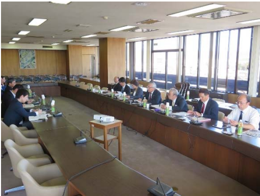
委員会室での研修風景

平成26年度から始まった寺子屋事業も平成28年度より事業を再編し、「かかみがはら寺子屋事業2・0」としてバージョンアップしました。この事業は子どもた